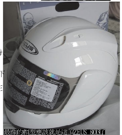
最像的帽型應該就是這頂ZEUS 803了