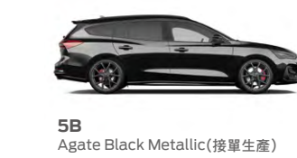
5B Agate Black Metallic (接單生產)

*本標示之油耗測試係在實驗室內，依規定的行車型態對車體動力計上測得。實際道路駕駛時，因受天候、路況、載重、使用空調系統、駕駛習慣及車輛維護保養等因素影響，其實際油耗值常低於測試值。年耗油量計算方式：以年平均行駛 15,000 公里除以油耗測試值計算，詳情請見經濟部能源局網站。*全車系符合汽車第六期廢氣排放標準。*系列數值為標準值未含容許公差。*行李廂空間為 FORD 原廠 ISO 3832 方式進行丈量。此為參考數值且會受裝配差異。*上述 0-100 km/h 加速僅為歐規 FOCUS ST X 6MT 及 ST X WAGON 測試參考數值，車輛實際性能會因行駛場地、駕駛習慣、駕駛模式、懸吊系統、等因素而有所差異。詳細配置說明請參照車主手冊。*FORD MATRIX LED 矩陣式智能動態照明系統，可能會因外在環境或道路狀況多元變化，導致部分功能無法達到您所預期之效果。*此為展示車型，外觀樣式及內裝配備與實際上市車型有所差異，請以實際販售之車型及規格配備為準。*產品持續研究改進為本公司一貫經營理念，福特及汽車公司保留產品規格配備變更或停用之權利。