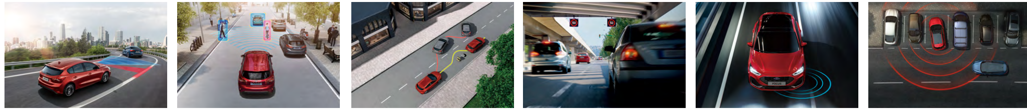
iACC 智慧型定速巡航調節系統 (附低速跟車)

NEW FOCUS ST X 採用最新升級的 Ford Co-Pilot360™ 全方位智駕科技輔助系統，整合多項傲視同級的駕駛輔助科技，打造前向、側邊、後向全方位智能安全。全新導入的進階駕駛輔助科技，替已臻頂尖的主動安全，強上加強，打造最稱心的行駛路程，和最雄心的熱血里程。