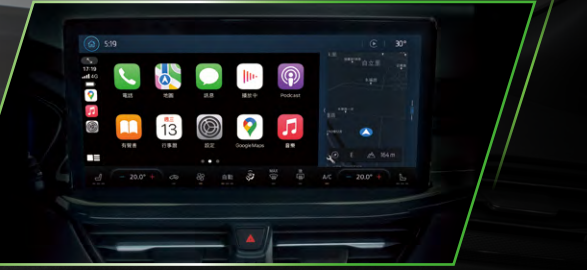
13.2 吋 SYNC® 4 娛樂通訊整合系統內建原廠導航 (支援無線 Apple CarPlay® 與 Android Auto™)