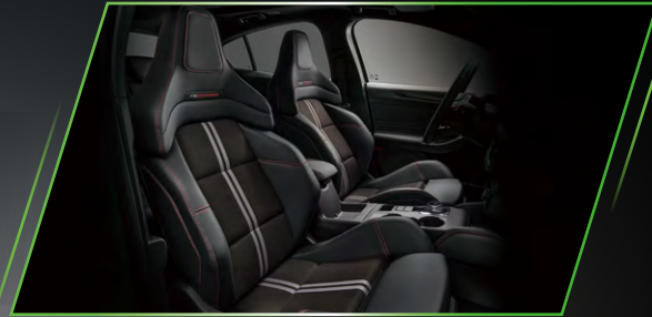
FORD PERFORMANCE 性能跑車電動座椅 (14 向調整 / 座椅加熱功能)

全新世代科技性能座艙設計，搭載 FORD PERFORMANCE 性能跑車電動座椅，榮獲德國背脊健康組織 (AGR) 認證，在享受性能駕馭的同時，也能擁有細膩舒適的乘坐感受。座艙科技升級搭載全新世代無線連接技術 13.2 吋 SYNC® 4 娛樂通訊整合系統，以最先進的人性化數位技術，輕鬆掌握整體駕駛資訊，這，就是新世代的座艙魅力！