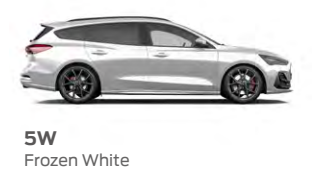
5W Frozen White