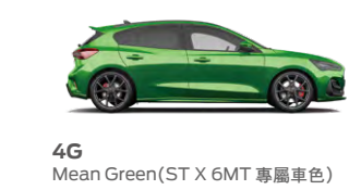
4G Mean Green (ST X 6MT 專屬車色)