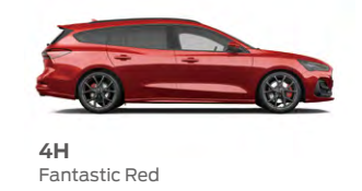
4H Fantastic Red