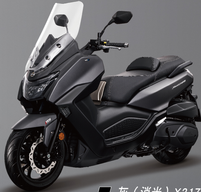
灰 (消光) X217