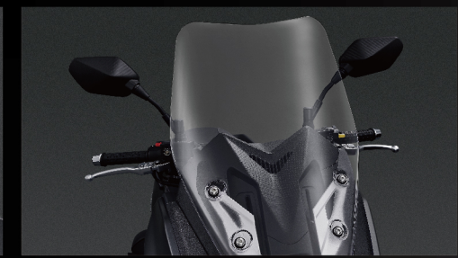
手動可調風鏡(兩段)