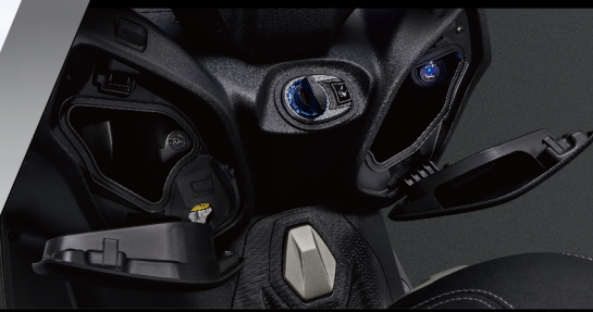
KEYLESS 智慧免鑰匙系統 + QC 3.0 充電座