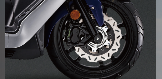
前刹輻射四活塞卡鉗