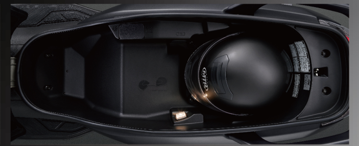
W.O.S系統設計 超大容量置物空間