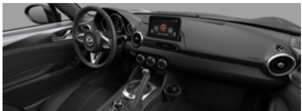
凌躍黑 / 黑色真皮座椅