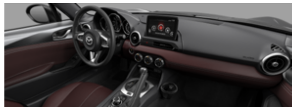
酒韻紅 / Nappa 紅色真皮座椅 *加價兩萬元