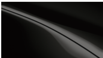
御鉄黑 (MX-5 RF 不適用)