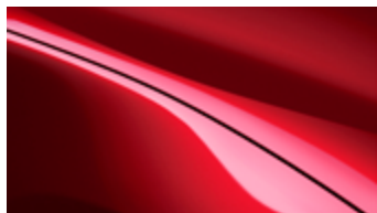
晶艷魂動紅 *加價一萬五千元 (酒韻紅內裝不適用)