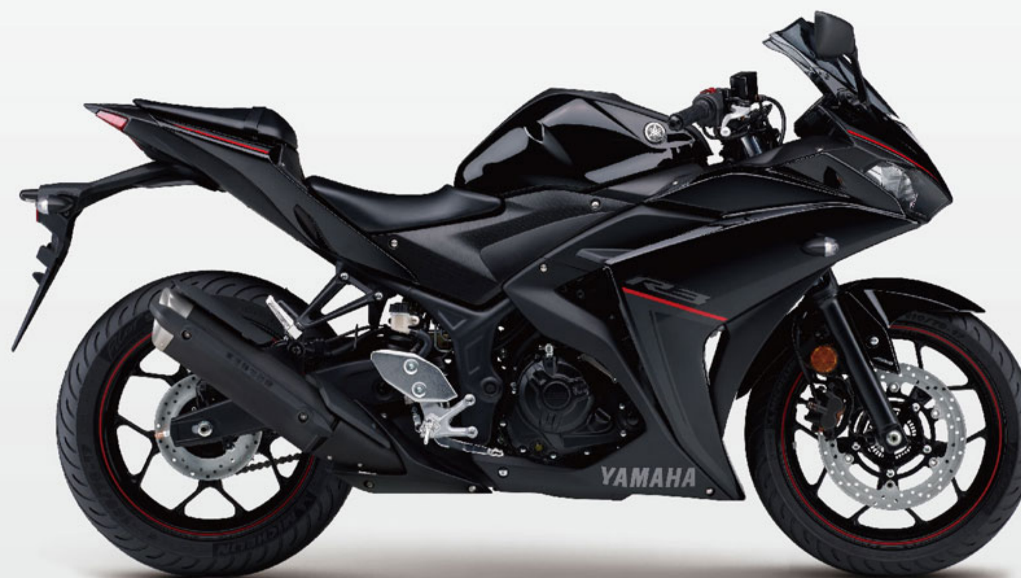
R3 ABS 規格表