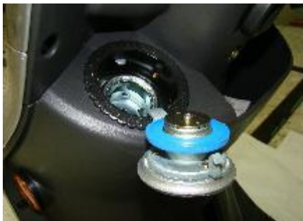
專利加油口,輕鬆上蓋 《輕鬆蓋》