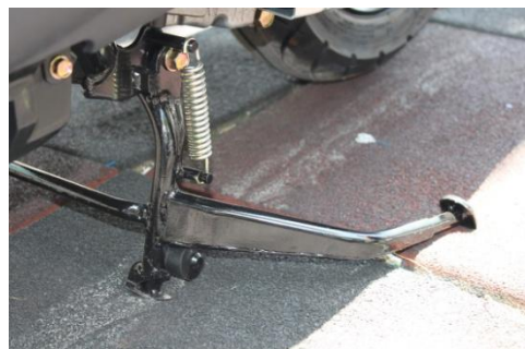
加長省力型駐車架