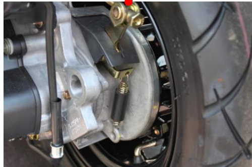
φ 130mm 後煞車輪轂