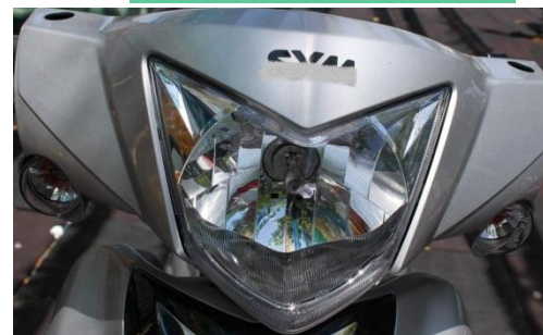
HS1 12V 35/35W 燈泡亮度低