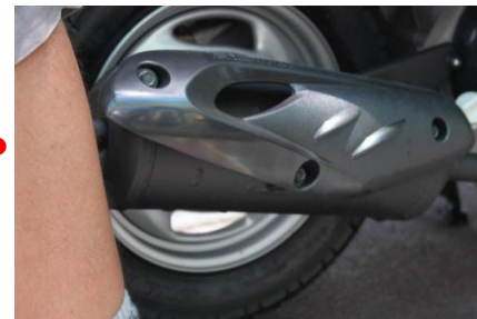
排氣管隔熱不完全，容易燙傷