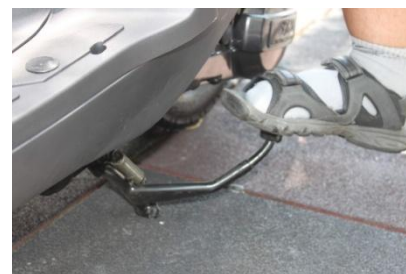
傳統費力型駐車架