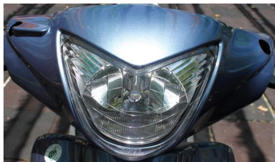
H4 12V 60/55W 燈泡亮度高