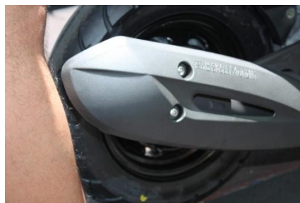
排氣管隔熱完全，安全防燙