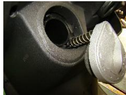
需旋轉特定角度上蓋 (蓋麻煩)